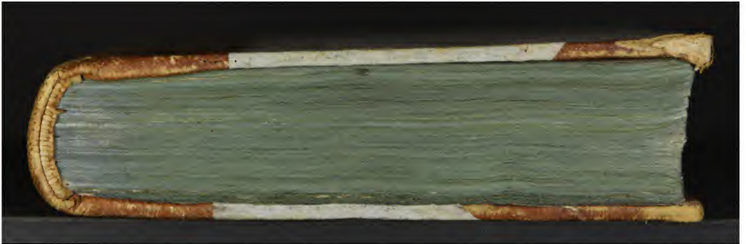
Magl. A.7.6